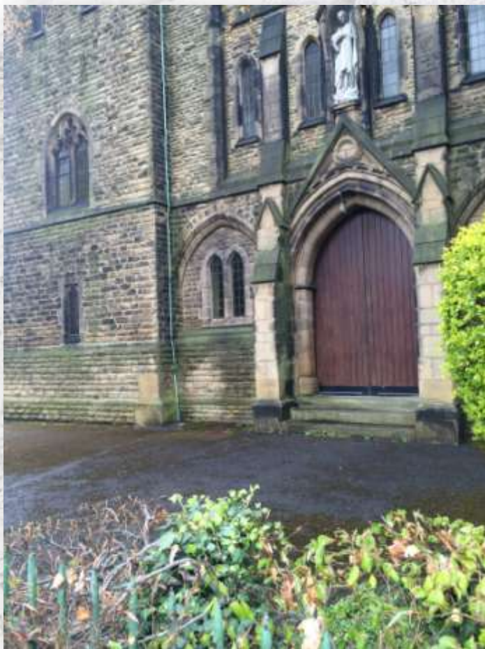
教会大门 英国曼彻斯特