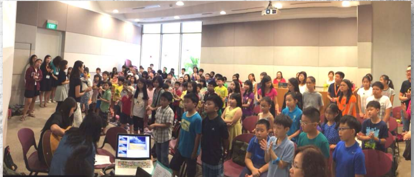
儿童门训开幕, 礼堂